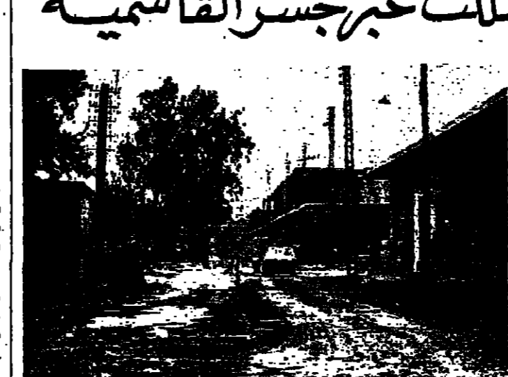
مواقع الجيش عند منزل زفتا